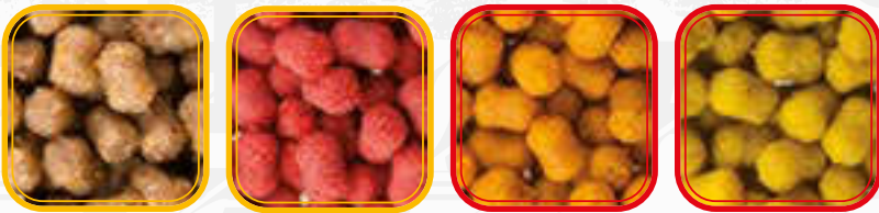
Crisalide Krill Tutti Frutti Vaniglia

Micro dumbbells disponibili nelle misure da 6 ed 8 millimetri studiate principalmente per il feeder fishing, possono trovare impiego anche nello specialist per la ricerca di barbi, carpe e breme in ambiente libero. Come tutta la gamma dei Cookie, anche le Dumbells presentano una base di birdfood. Grazie alla struttura compatta, si caratterizzano per un'altissima resistenza sia agli attacchi della minutaglia, sia alla violenta accelerazione nei lanci a lunga distanza. Fortemente consigliate per le sessioni di pesca in luoghi in cui il pesce risulta in forte attività.