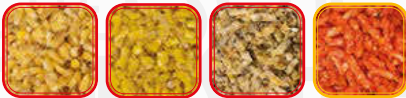
Mais Mais Banana Mais Canapa Mais Fragola

Singolare composto morbido al mais che esercita un forte potere attrattivo. In acqua ha un'azione molto veloce. Si disgrega solo parzialmente e le particelle più leggere risalgono verso la superficie, attirando il pesce nell'area. Le pellets Cookie risultano adatte per la pasturazione con la coppetta nella pesca al colpo e per la pesca a feeder essendo ottimale per il caricamento sia dei pellet feeder, sia di classici pasturatori a gabbia.